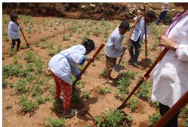
Culture de pomme de terre par les enfants de Andohavondrona