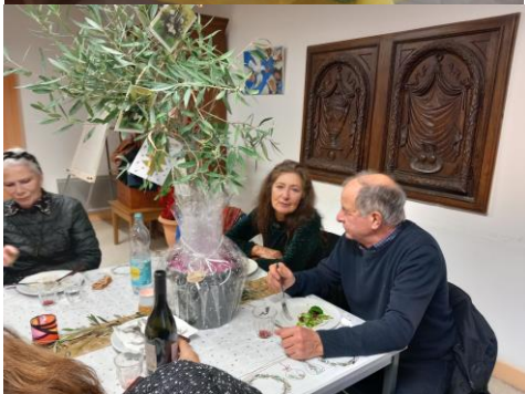
L'Olivier de l'amitié

C'est promis, nous réitérerons l'an prochain ! FGG