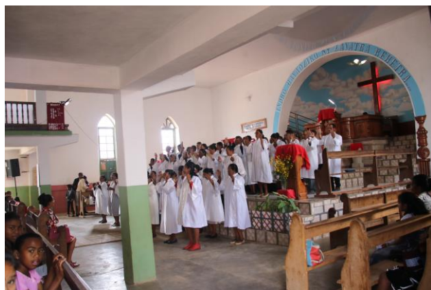
Eglise protestante de Faratsiho